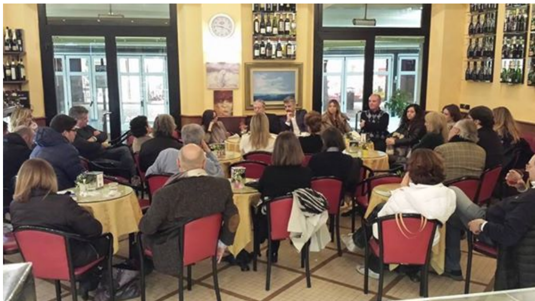
Foto al Caffè Florian di San Benedetto del Tronto