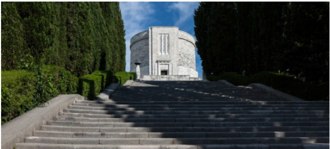
Il Sacratio di Oslavia - Gorizia