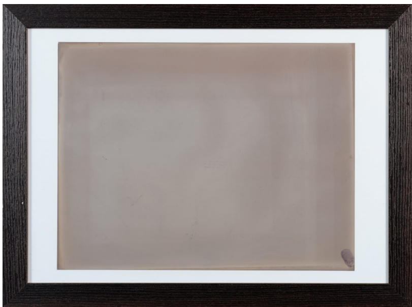
Prini Emilio, Senza titolo (impronta), 1970, stampa alla gelatina ai sali d'argento, 30x40 cm