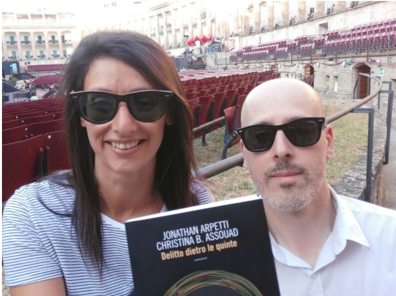
Assouad e Arpetti

Un giallo tutto italiano ambientato per le strade di una Macerata che per un mese si trasforma nella capitale dell'opera lirica.