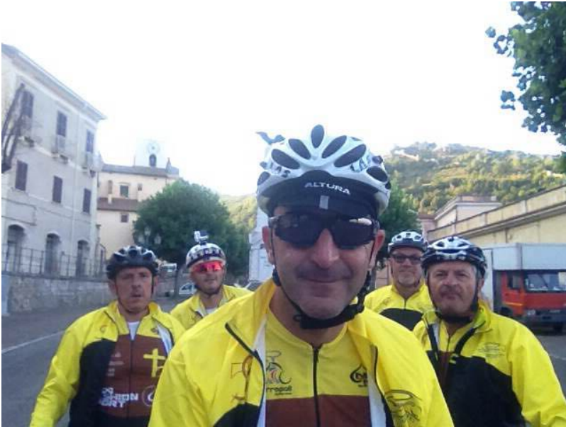
Colazione a Roccasecca