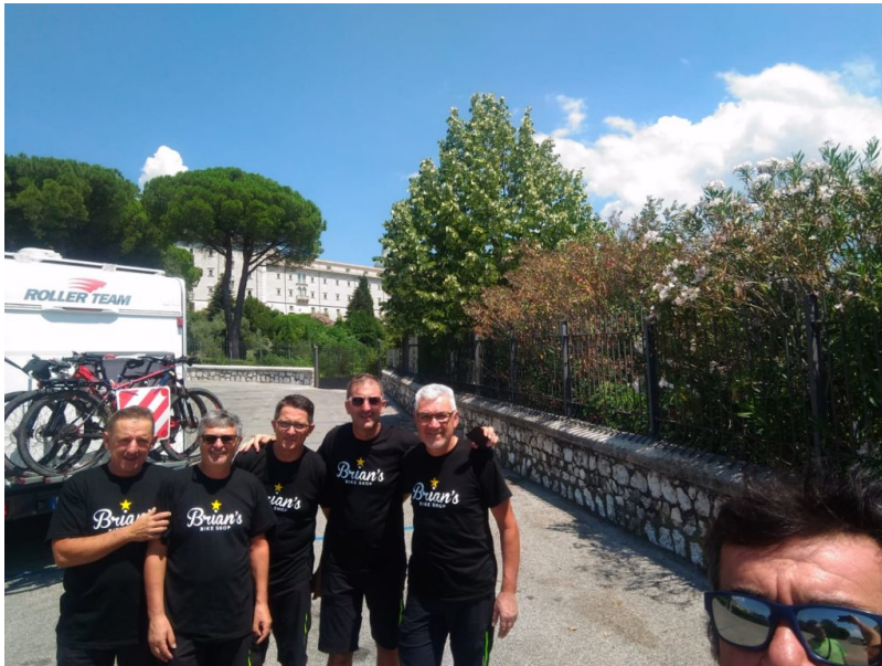
Prima di partire per Corropoli da Montecassino