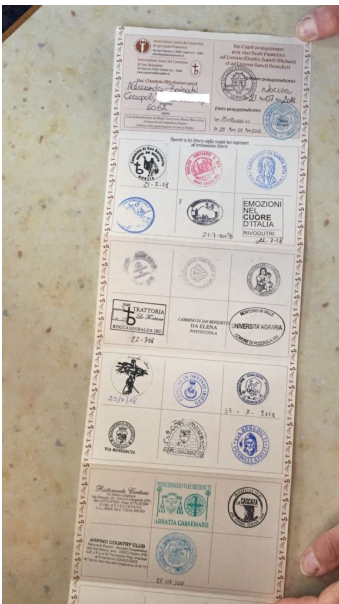
Timbri e credenziali lungo il percorso Norcia-Montecassino