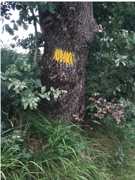
Simboli e segnali lungo il tragitto