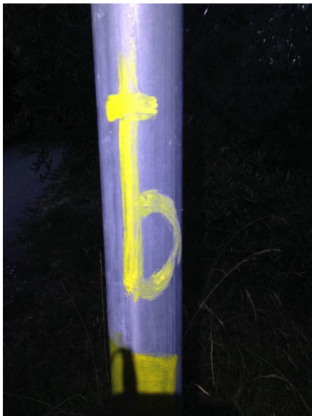
Simboli e segnali lungo il tragitto