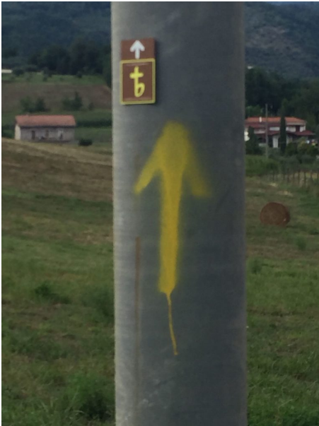
Simboli e segnali lungo il tragitto