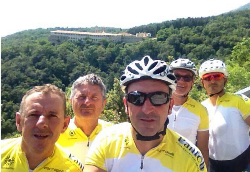
foto con la Certosa di Trisulti