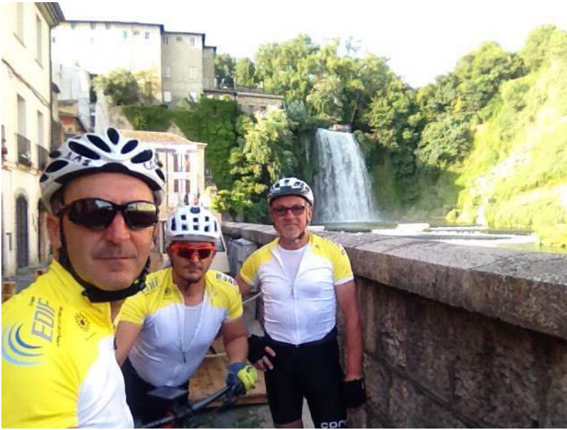
Le cascate al centro del paese di Isola Liri