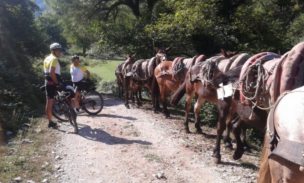
Diritto di precedenza