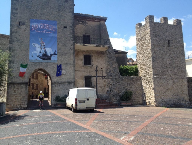
Borgo Medievale Vico nel Lazio