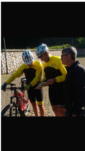
La partenza della mattina