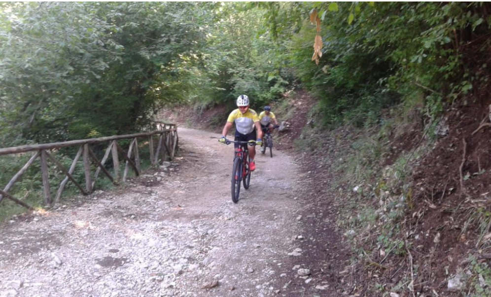
Sentiero Altopiano Arcinazzo