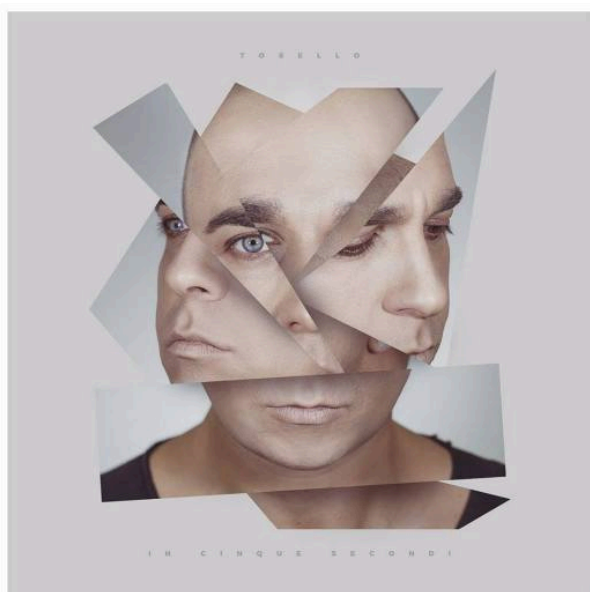
Copertina del CD