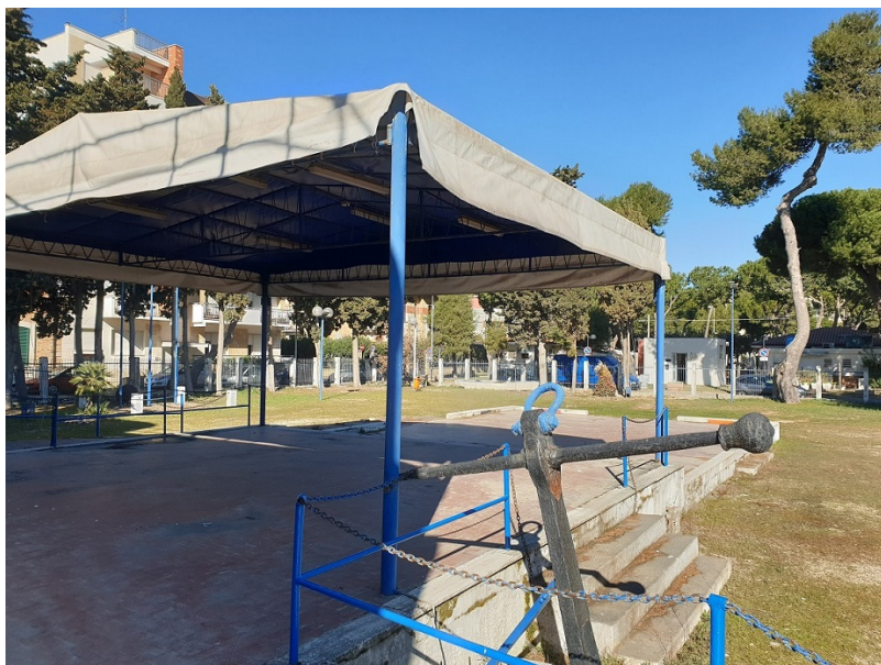
Circolo Nautico Prima sede