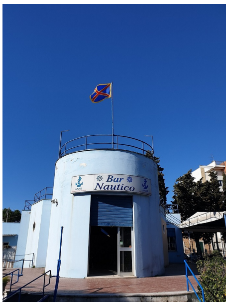
Circolo Nautico Prima sede