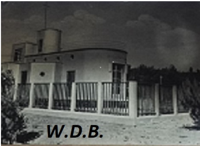
Circolo Nautico Giulianova cartolina d'epoca 1942