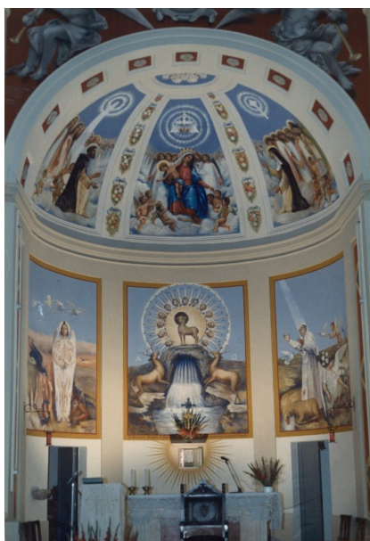
abside Chiesa del Rosario affrescata negli anni 50

Nel corso del convegno sarà presentato ed esposto al pubblico il dipinto inedito dell'abruzzese Francesco Patella, artista di chiara fama nazionale che espose, nell'arco della sua vita, in Biennali e mostre di profilo nazionale ed internazionale, insieme a personalità quali Basilio e Tommaso Cascella, Nicola D'Antino e Guido Costanzo.