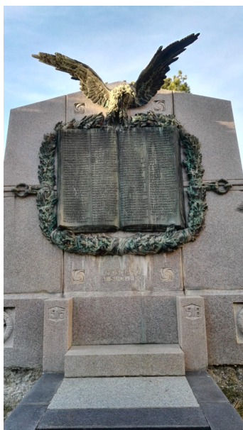
Lapide dei caduti della 1° Guerra Mondiale di Mosciano Sant'Angelo, (C) Foto Walter De Berardinis