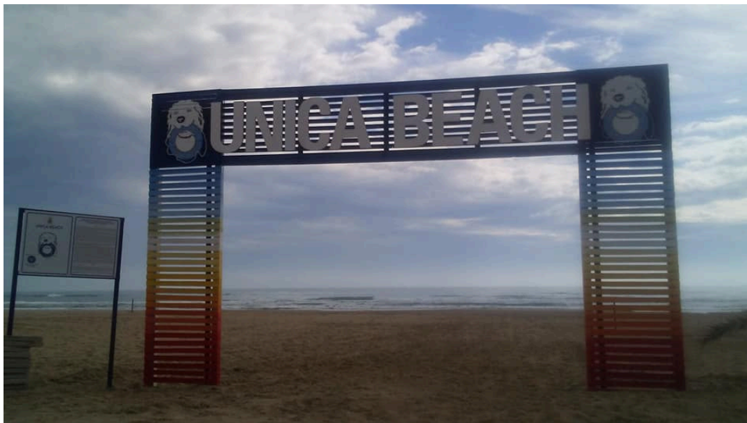
Unica Beach 2019

E' sabato 1 giugno alle ore 17,30 che la spiaggia “per cani” più grande e più famosa in Abruzzo, torna ad essere attiva e ad accogliere cani di ogni razza e taglia.