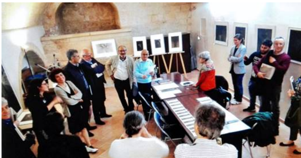
Allegare