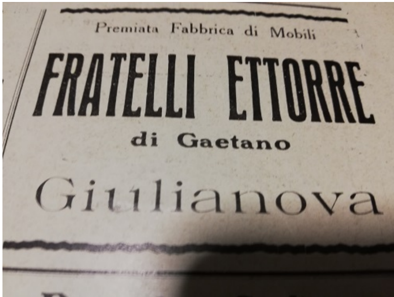
Pubblicità Fratelli Ettore nel 1930 a Giulianova