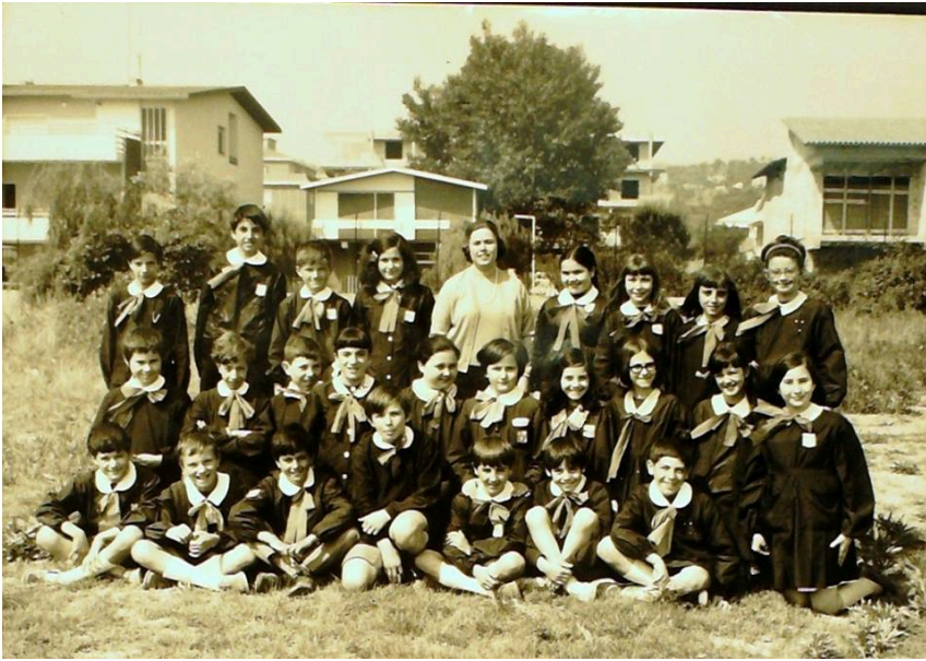
classe V anno scolastico 1969 - 1970 Ospizio Marino