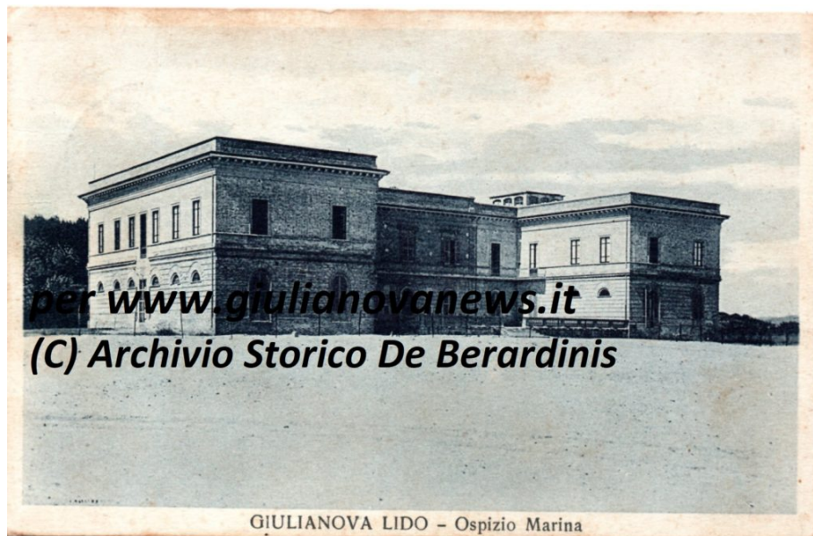
Ospizio Marino di Giulianova

Da tempo, infatti, le ricerche di Galantini, in particolare quelle sulla storia del turismo sociale a Giulianova, sono state puntualmente richiamate in importanti convegni e volumi scientifici. Da quella sulla ex colonia Maltoni Mussolini di Giulianova negli atti del 6° Congresso internazionale di storia delle costruzioni tenutosi a Bruxelles nel luglio 2018, lo scorso luglio, all'inserimento nel volume La evolución de la industria turística en España e Italia pubblicato dall'Institut Balear de Economia di Palma di Maiorca.