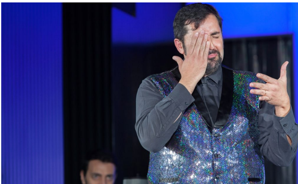
“Io sono Abruzzo!” di Federico Perrotta

Abruzzese e fiero delle proprie origini, l’attore Federico Perrotta ama da sempre parlare della sua regione e tornerà a farlo davanti al suo pubblico con il noto spettacolo “Io Sono Abruzzo!” a Vasto (Chieti); saranno i Giardini di Palazzo d’Avalos ad ospitare domenica 13 settembre alle ore 21.30 l’appuntamento tutto da ridere e dedicato all’ Anffas Onlus , sede di Vasto e alle attività che svolgono coloro che ne fanno parte. La serata è possibile grazie alla collaborazione dell’associazione con il Comune di Vasto.