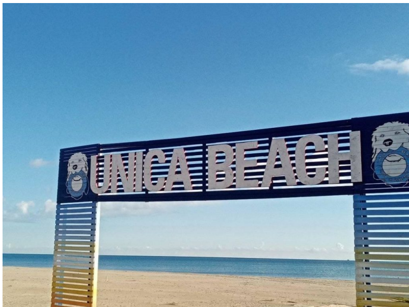
unica beach ingresso