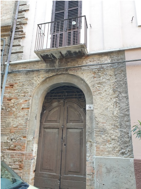
la prima sede del pcdi in via battisti 70 a Teramo