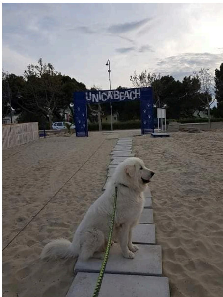
Unica Beach 2019