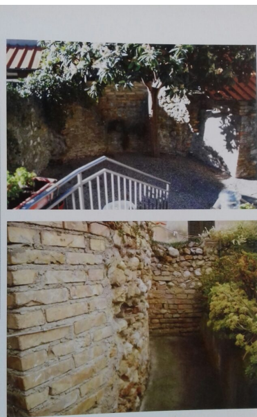
Le mura antiche di Giulianova lato ovest