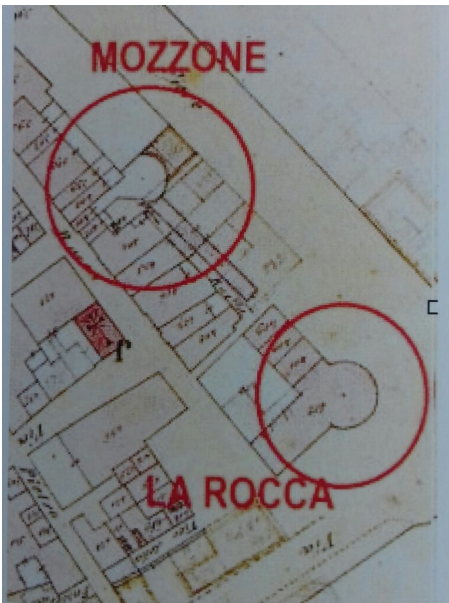
Le mura antiche di Giulianova lato ovest