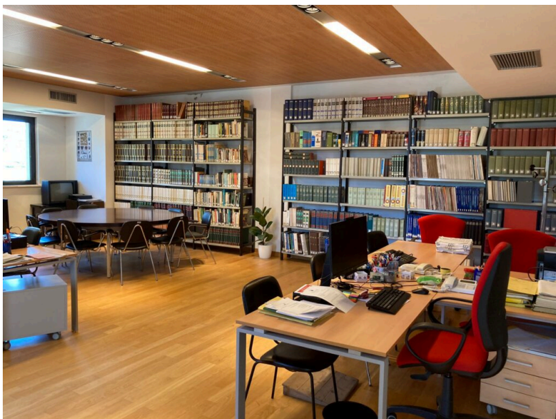
La nuova e spaziosa sede ubicata nei locali