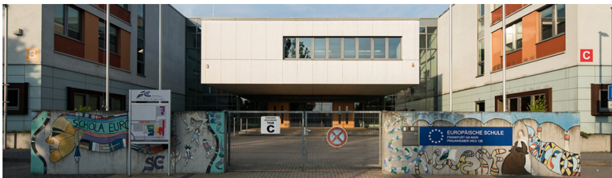
European School Frankfurt (Europäische Schule Frankfurt am Main)

De Berardinis racconterà la vicenda della coppia internata a Tossicia e Civitella del Tronto