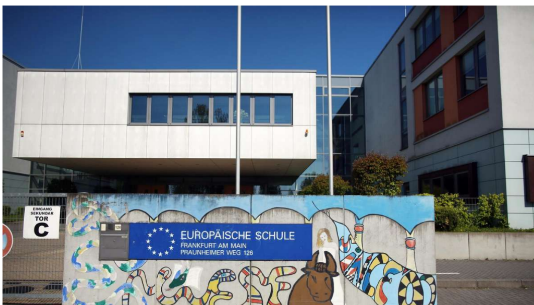
European School Frankfurt (Europäische Schule Frankfurt am Main)