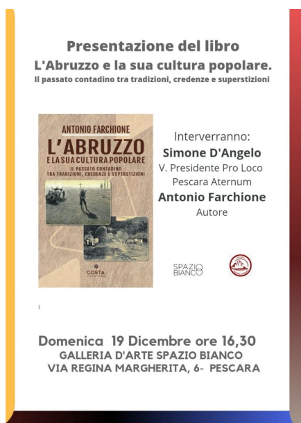
manifesto Libro Farchione