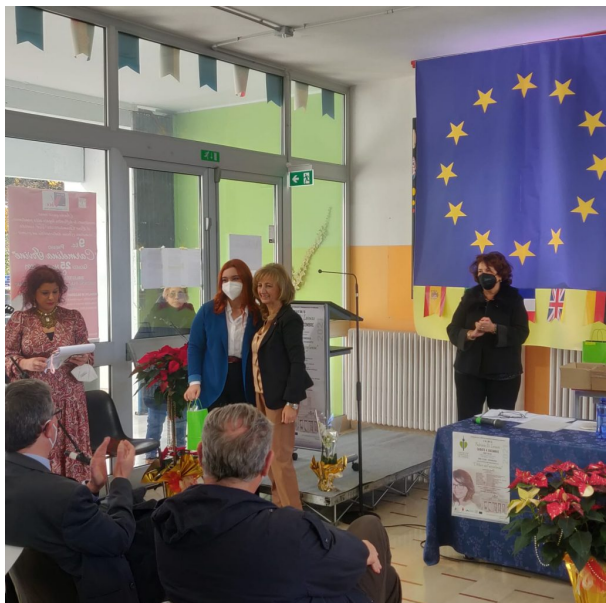
Premio Fabrizia Di Lorenzo 2021