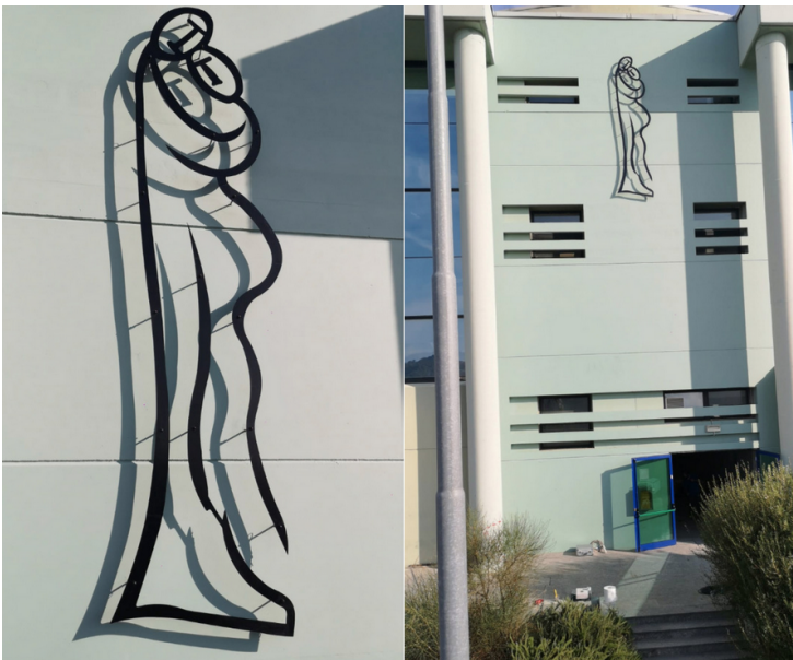
Alejandro Marmo, Abbraccio

Il 15 dicembre 2021 il Contemporary Sculpture Garden dell'Università di Teramo, curato dalla prof.ssa Raffaella Morselli, delegata del Rettore alla Cultura, inaugura uno spazio web dedicato allo scultore Alejandro Marmo (Buenos Aires, 1971) e alla sua opera L'abbraccio. L'evento rientra nel programma VRSCIT e nell'ambito della Settimana del Contemporaneo. Il nuovo spazio web mette a disposizione del pubblico un profilo dello scultore, una video-intervista inedita, una scheda completa dell'opera e una video-presentazione sul tema dell'abbraccio, realizzati da quattordici studenti del corso di Comunicazione Museale, tenuto presso la Facoltà di Scienze della Comunicazione, CdS in Scienze della Comunicazione e CdS in DAMS.