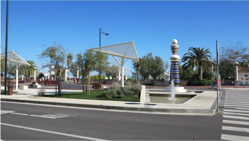
Piazza Dalmazia Summa