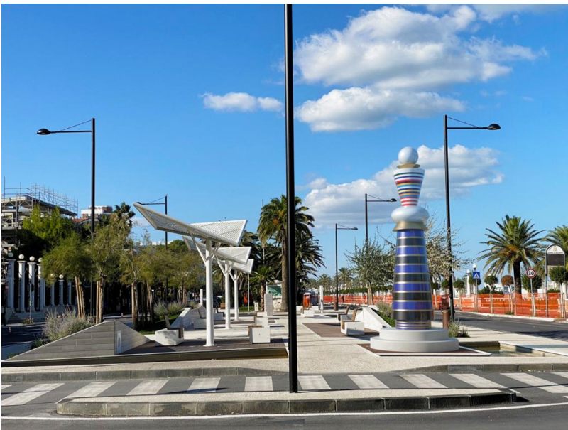
Piazza Dalmazia Summa