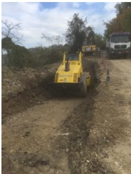
provinciale 34, febbraio 2022, ARSITA