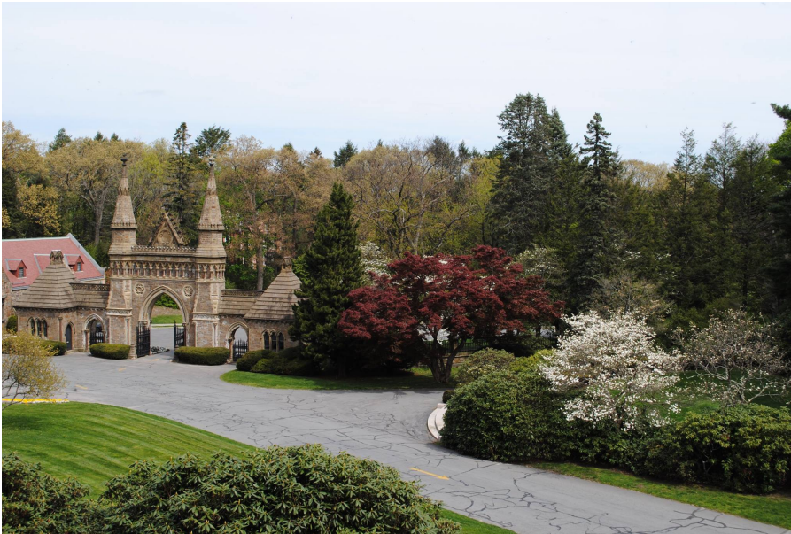
Forest Hills Cemetery