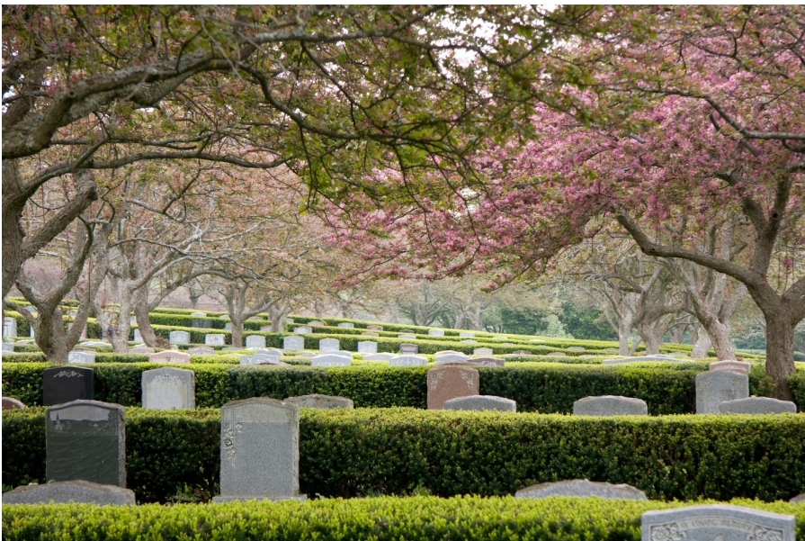
Forest Hills Cemetery