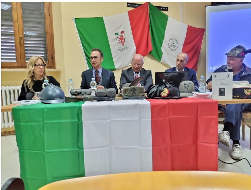
Bellante nella Grande Guerra