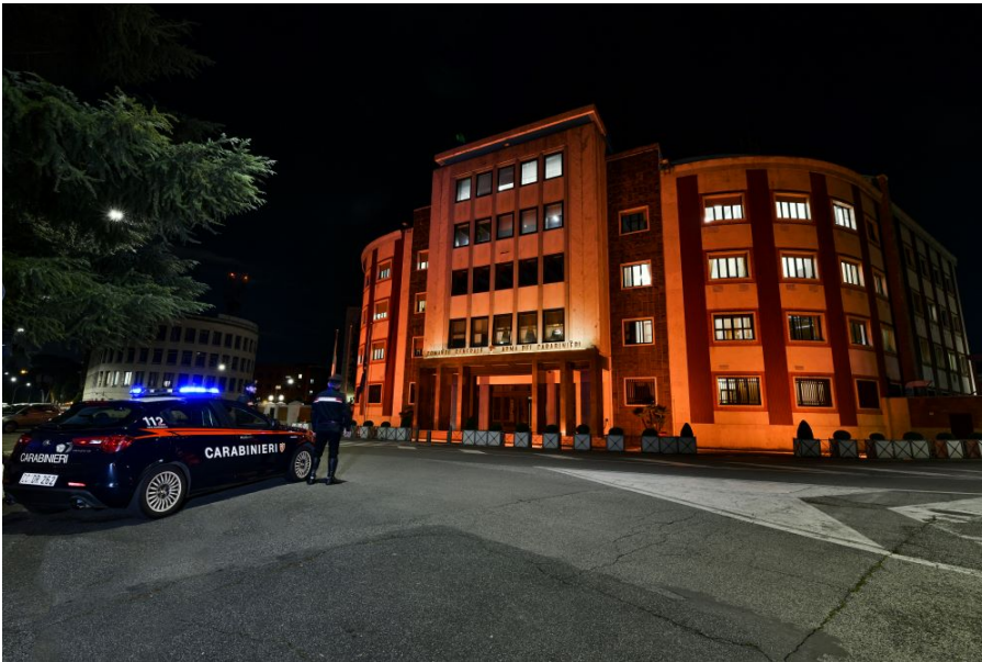
Comando Generale Arma dei Carabinieri