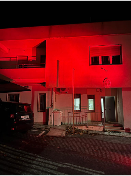
Caserma Carabinieri Tossicia