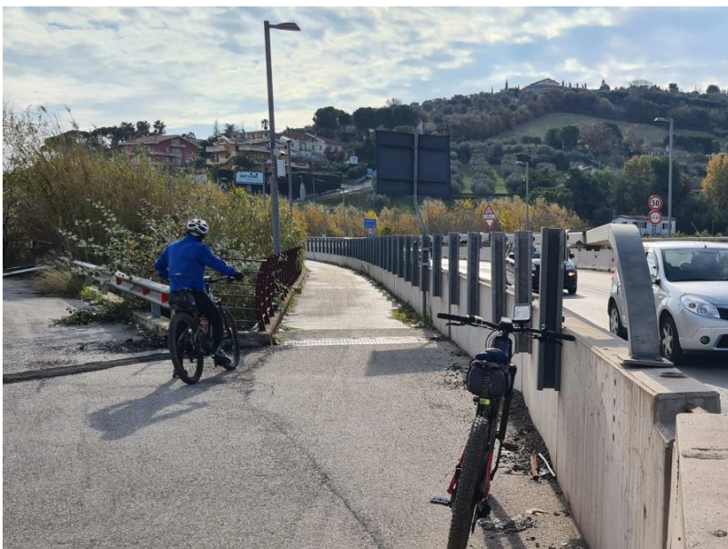
Superamento del fiume Tronto