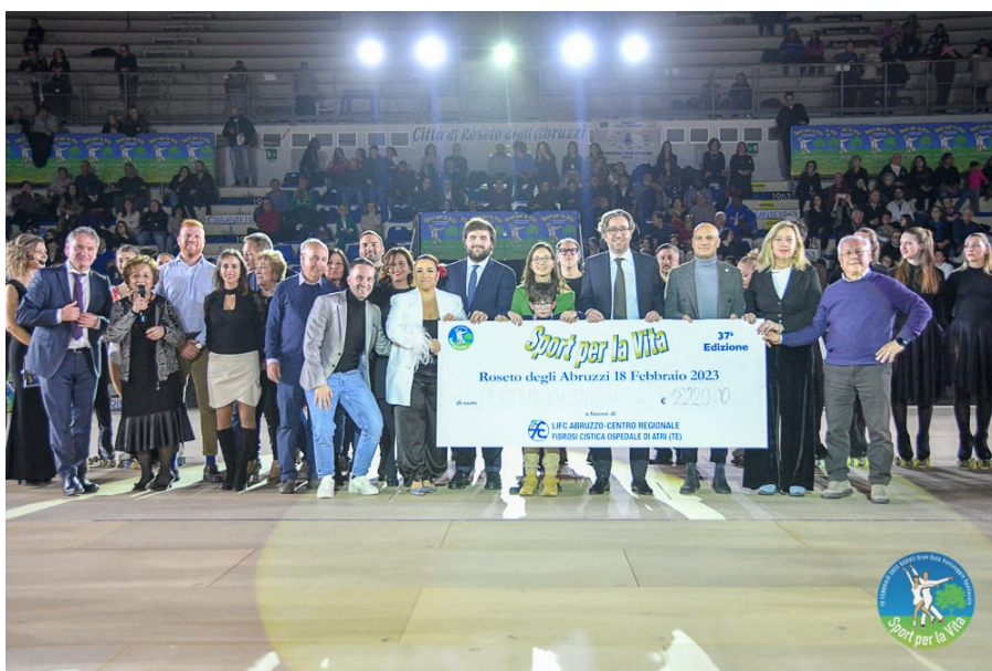
L'assegno di Sport per la Vita