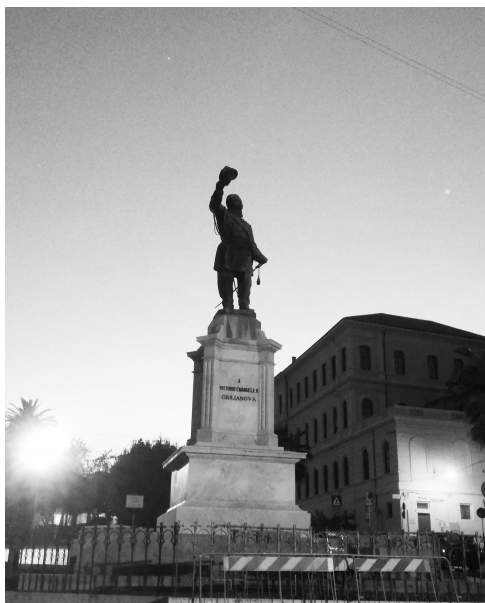
Giulianova Re Vittorio Emanuele II Giulianova