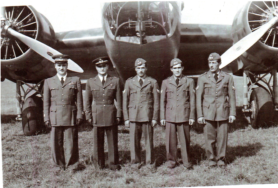
Archivio De Berardinis