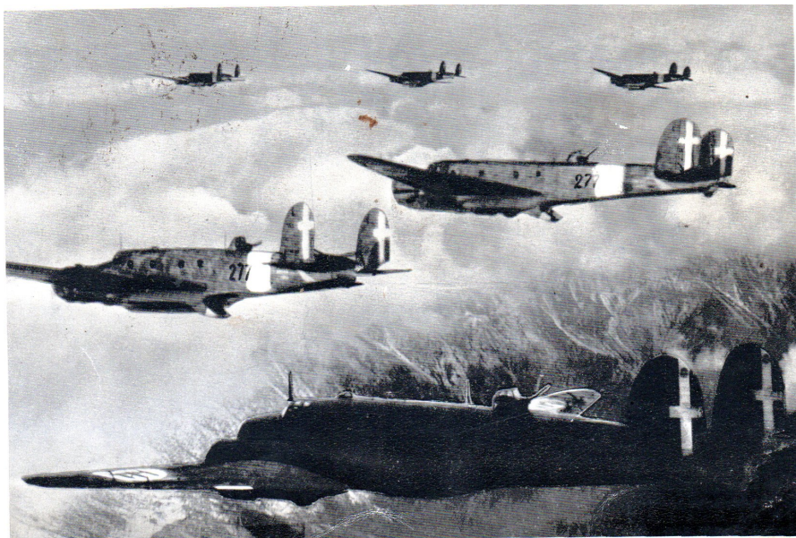
Archivio De Berardinis