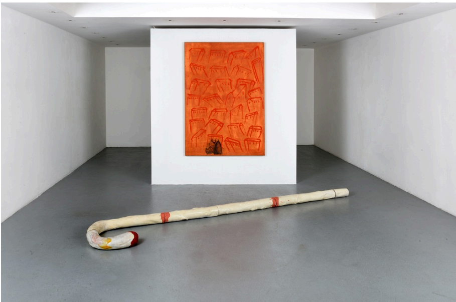
Enzo Cucchi, Senza titolo, 1978