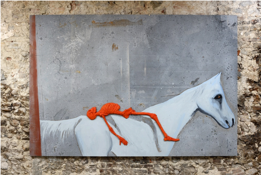
Enzo Cucchi, La vita morta, 2021