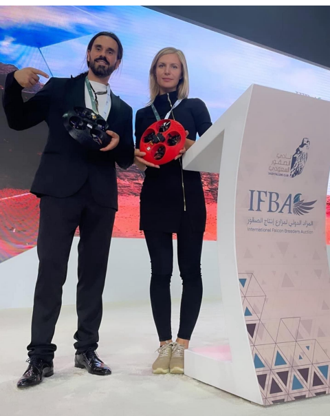
Il Prototipo di Rover potrà essere utilizzato in diversi scenari,