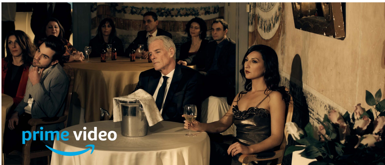
Unlucky to Love You - Frame Grab