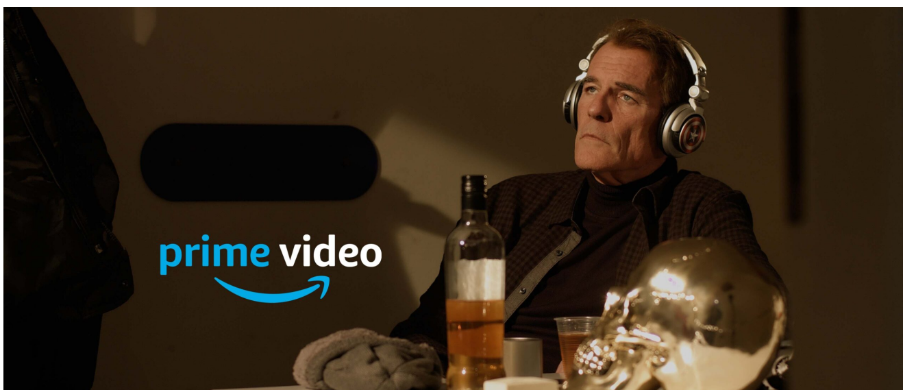
Unlucky to Love You