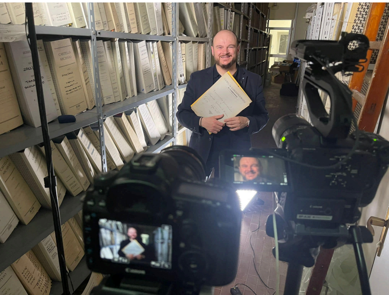
L'autore, Giuseppe Lorentini