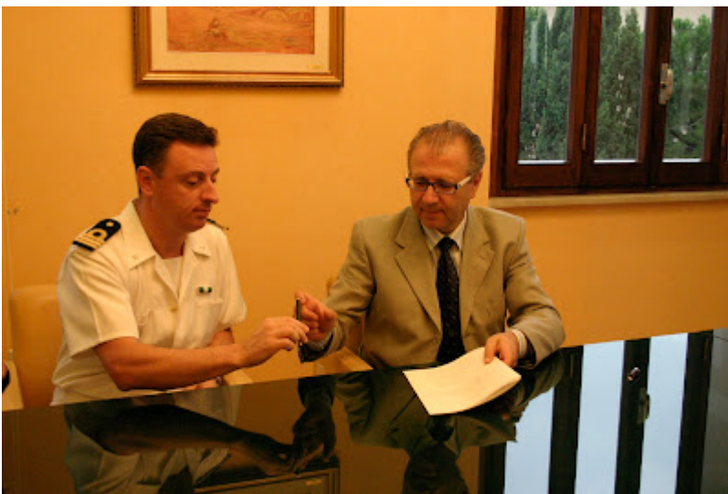
Capitaneria di Porto per il potenziamento delle attivit