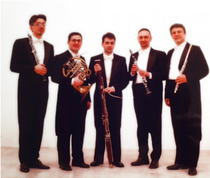
CHIETI (04/08/2009) - Si terr