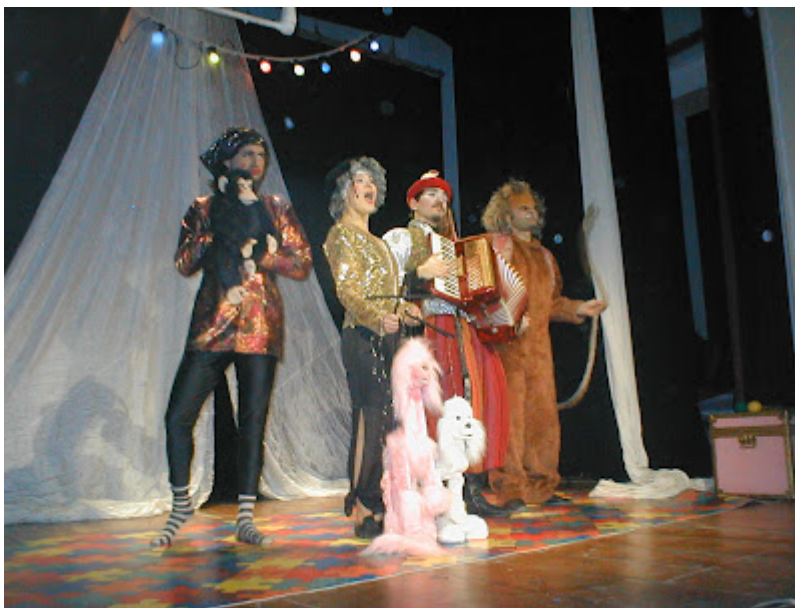
“R...estate bambini 2009”