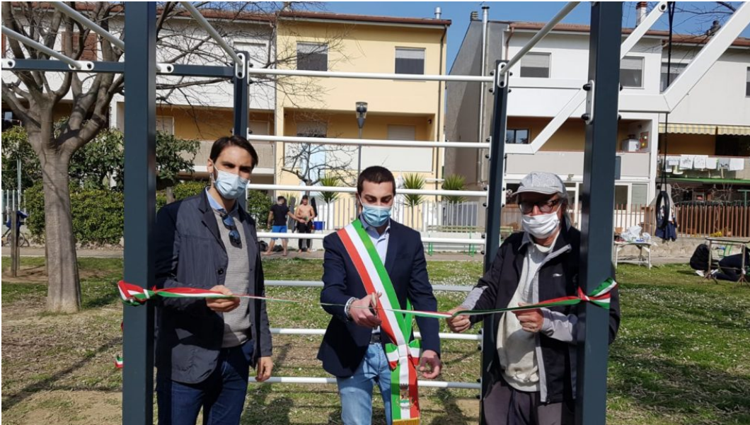
inaugurazione attrezzo calisthenics

GIULIANOVA - E' stato installato nel parco del quartiere Annunziata un attrezzo sportivo per la pratica del calisthenics, acquistato dal Comune di Giulianova per favorire la pratica degli sport all'aperto.