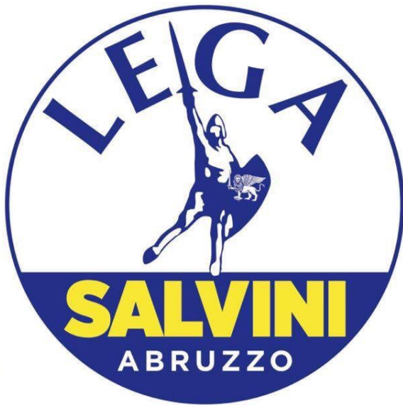
Lega Giulianova Abruzzo

Lo sanno bene i consiglieri del Cittadino Governante, perché ne hanno fatto il motto per la loro azione politica. Si prende un fatto o una situazione reale, si infarcisce con supposizioni, illazioni, frasi ad effetto, qualche omissione ben apposta e poi via si lancia sui social.