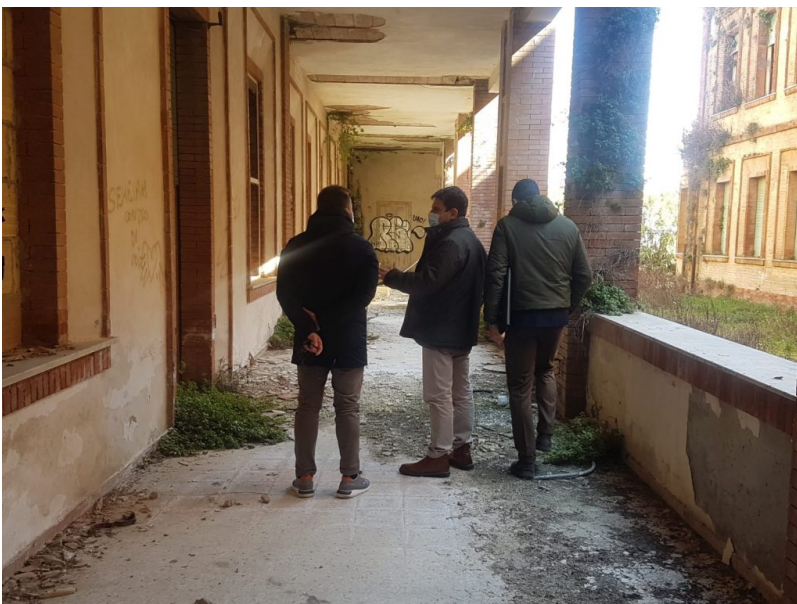
sopralluogo ex colonia rosa maltoni (2)

Partiranno a breve le operazioni di messa in sicurezza della struttura, a carico della società di gestione del risparmio del Ministero dell'Economia e delle Finanze, che includeranno la sostituzione dei cancelli e dell'intera recinzione, la manutenzione del verde, la chiusura di tutti i 240 accessi di porte e finestre dei tre edifici dell'ex colonia e l'istituzione di un servizio di vigilanza settimanale.