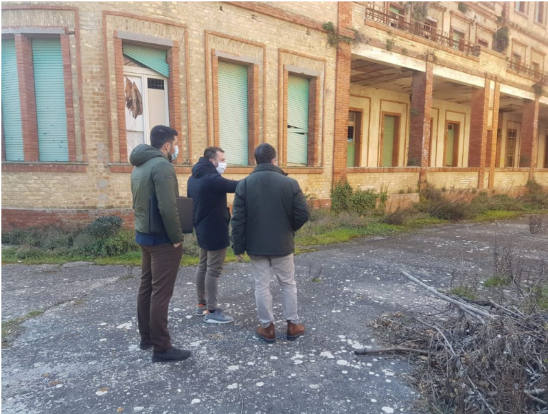
sopralluogo ex colonia rosa maltoni (1)