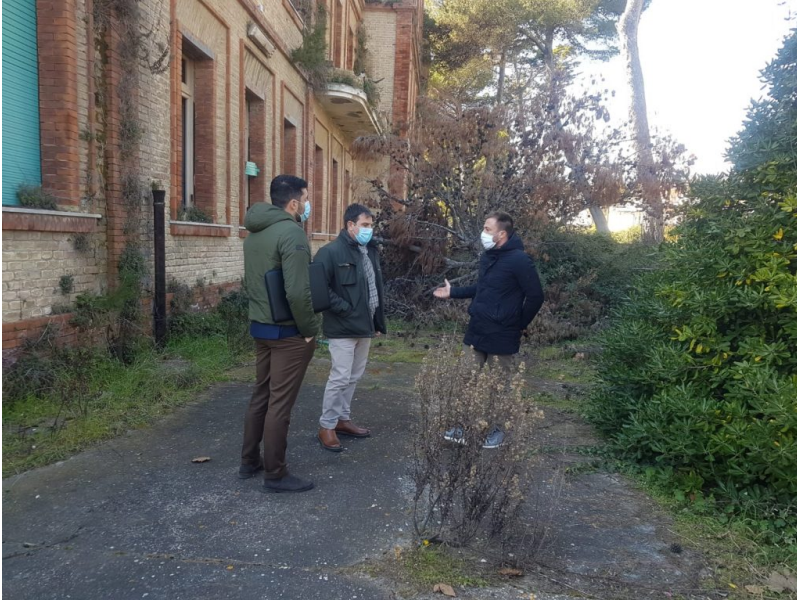
sopralluogo ex colonia rosa maltoni (3)

Accordo su lavori di messa in sicurezza su ingressi, verde e recinzione con l'istituzione di un servizio di vigilanza