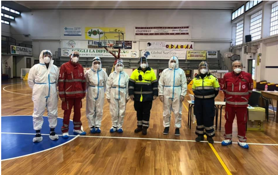
foto volontari screening covid-19 giulianova