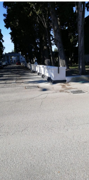
ingresso cimitero comunale