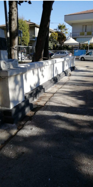
ingresso cimitero comunale