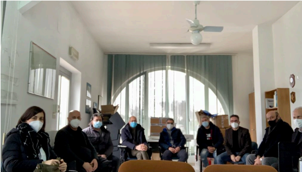
Ente Porto Giulianova