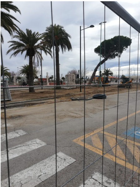
Piazza Dalmazia