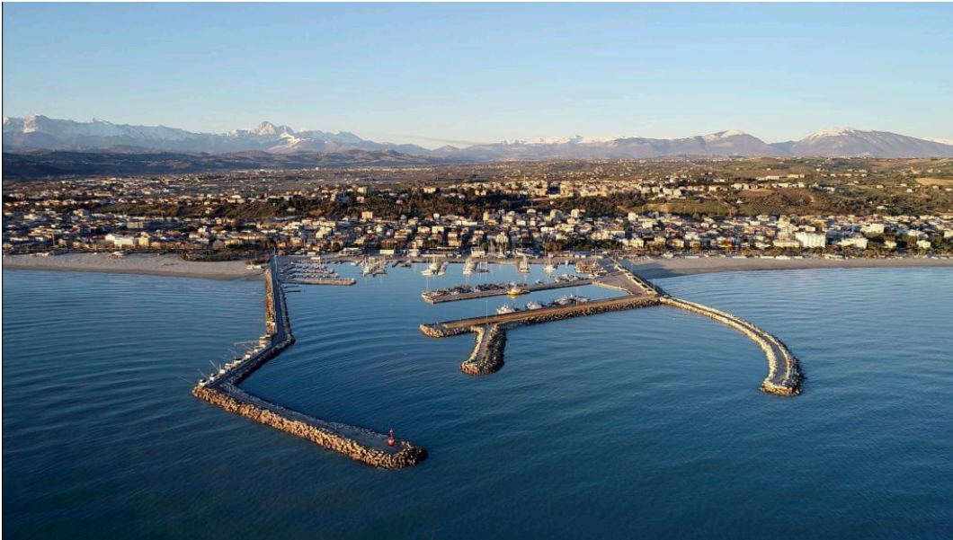
Porto di Giulianova