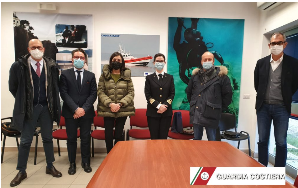
Ente Porto e Guardia Costiera 2021 - FOTO ARCHIVIO

Ai Membri del CdA dell'Ente Porto Giulianova