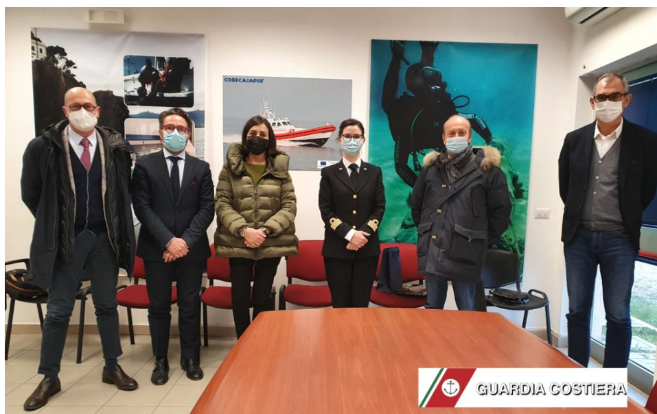
Ente Porto e Guardia Costiera 2021

Facendo seguito ai colloqui intercorsi, desidero confermare che l'elezione del sottoscritto alla Carica di Presidente dell'Ente Porto è avvenuta nel pieno rispetto dello Statuto dell'Ente e delle Leggi che regolano il funzionamento degli Enti Pubblici e loro Consorzi.