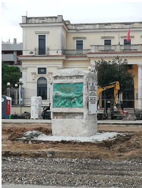
Il monumento oggi.

Confermiamo invece le altre considerazioni espresse, in particolare che dopo questi lavori non sarà più possibile in piazza Dalmazia ospitare grandi eventi come la Festa della Madonna del Portosalvo e i concerti.