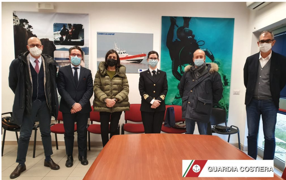
Ente Porto e Guardia Costiera 2021