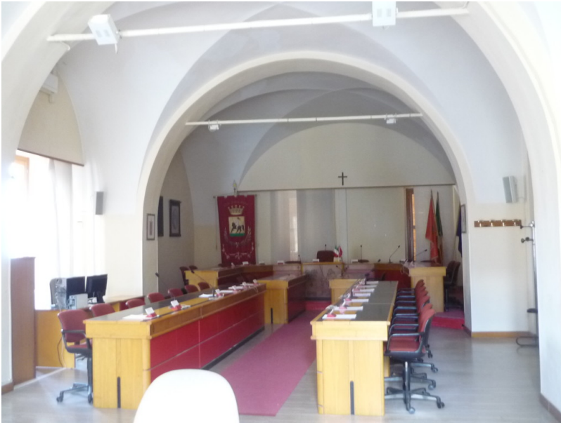
Sala consiliare del Comune di Giulianova