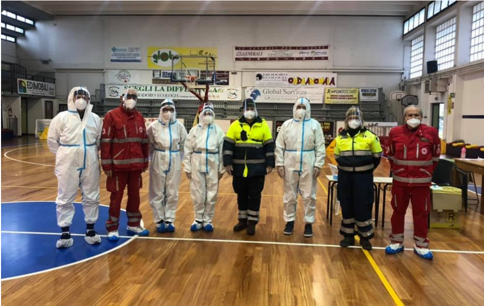
foto volontari screening covid-19 giulianova