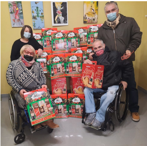
Colibrì natale 2020

Un natale di solidarietà, quello che il Colibrì Onlus di Giulianova regalerà a cinquanta famiglie del territorio. Nuova iniziativa benefica della virtuosa associazione di volontariato, che ricorda le donazioni di pacchi alimentari che, in occasione del primo lockdown, hanno contribuito a portare un po' di sollievo a chi si trovava in condizioni di difficoltà.