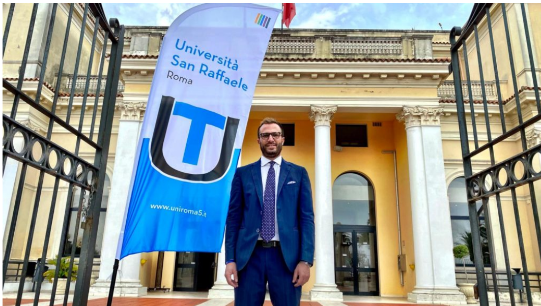
Kursaal - Costantini

Pasquantonio: "Attenzione ai territori come volano e sviluppo della conoscenza"