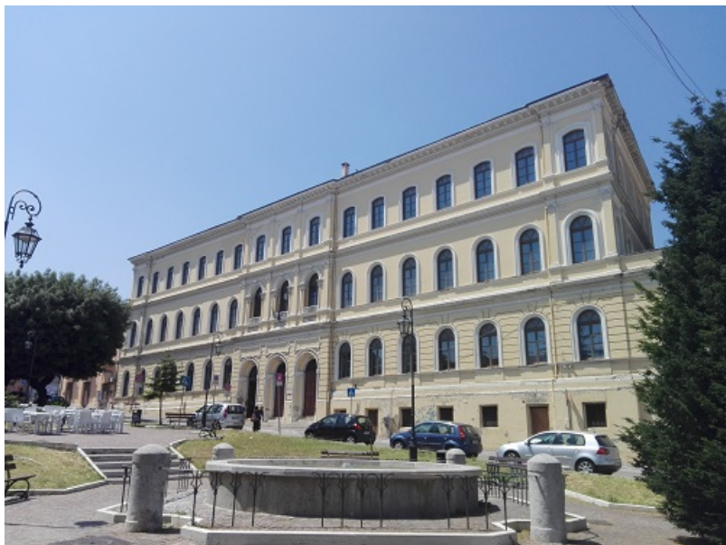
Scuola Edmondo De Amicis Giulianova . FOTO ARCHIVIO

Sono aperte le pre iscrizioni al servizio di Pre-Post Scuola per l'anno scolastico 2020/2021.