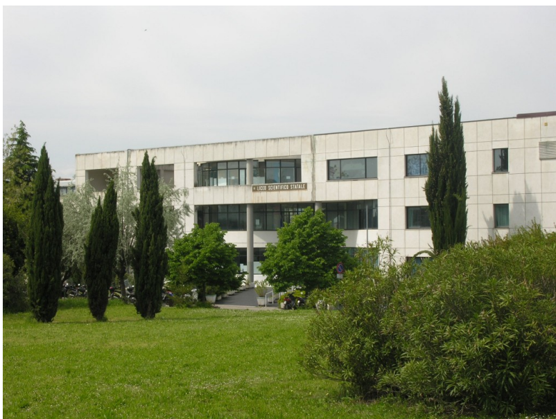
la sede Liceo Scientifico Marie Curie di Giulianova.

Teramo 28 settembre 2020. Il Liceo "Curie" di Giulianova con una nota inviata all'Ente questa mattina, fa sapere che entrambe le opzioni, un immobile sulla Statale 16 e un altro a Colleranese, potrebbero andare bene. In ambedue i casi ci sono interventi da prevedere non solo per la normativa anti -COVID ma anche per adeguare le strutture ad un ambiente didattico.