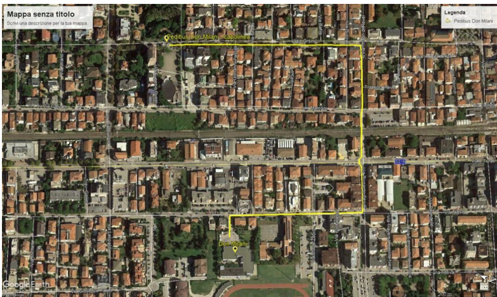
Pedibus Don Milani Giulianova