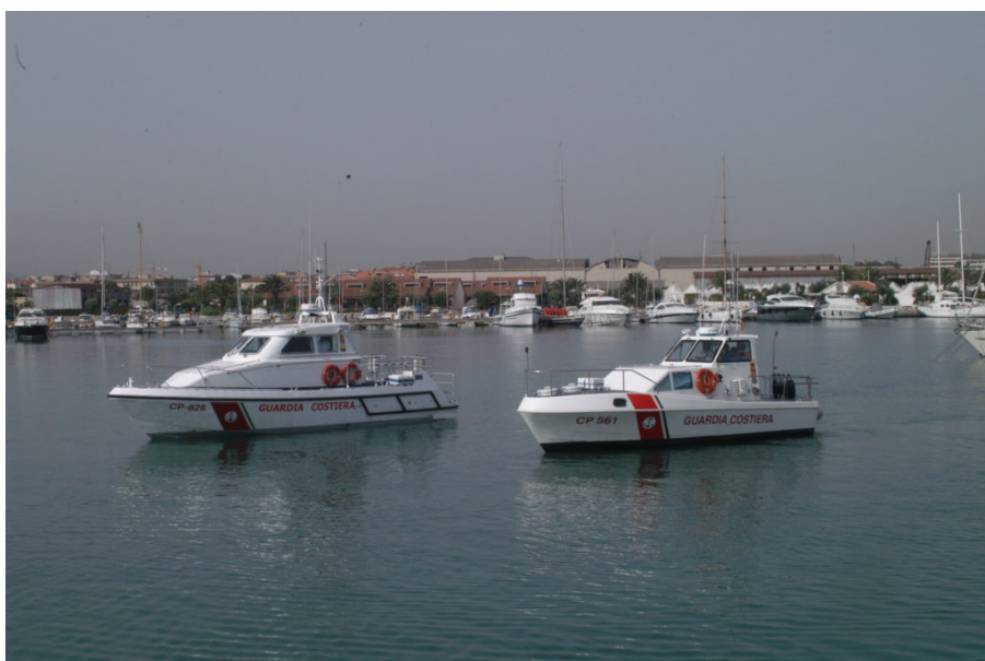
Guardia Costiera 2020