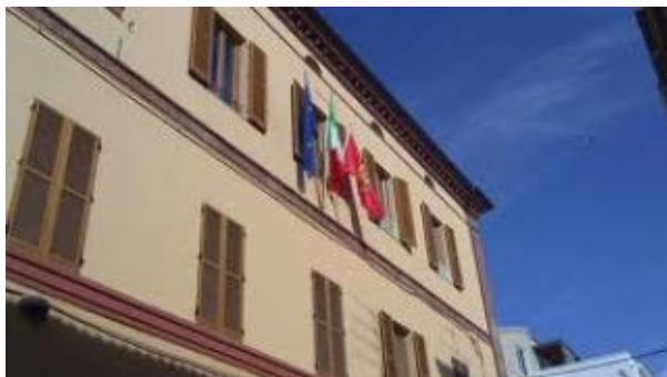
Comune di Giulianova

Grazie all'applicazione del nuovo regolamento comunale per l'Emergenza Abitativa e alla stesura della prima graduatoria delle istanze pervenute all'Ente, il Comune di Giulianova ha assegnato, con determina comunale e per la durata di un anno, i due alloggi di proprietà della Giulianova Patrimonio a due nuclei familiari che si trovano in una situazione di momentanea difficoltà economica, in possesso di tutti i requisiti elencati nel bando.