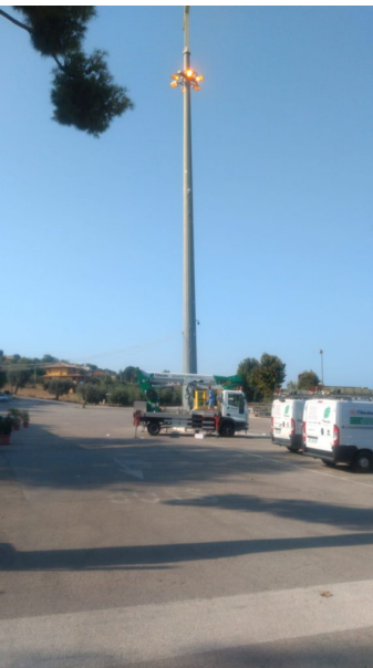
telecamere santuario madonna dello splendore (4)