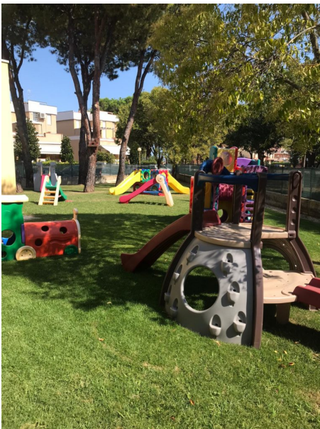
Giulianova, giardino Via Mattarella