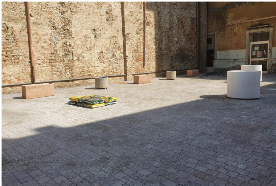
Pavimentazione piazzali scuola de amicis