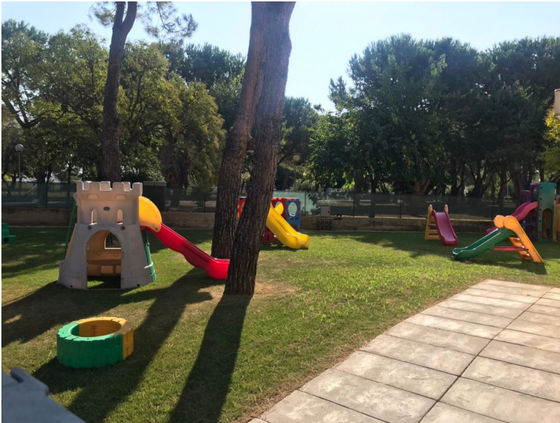
Giulianova, giardino Via Mattarella