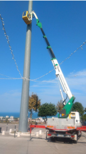
telecamere santuario madonna dello splendore (4)