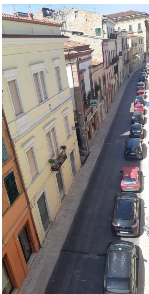
corso garibaldi giulianova

Da lunedì 14 settembre al via i lavori di sistemazione dell'intera pavimentazione di corso Garibaldi e della parte carrabile di piazza Buozzi.