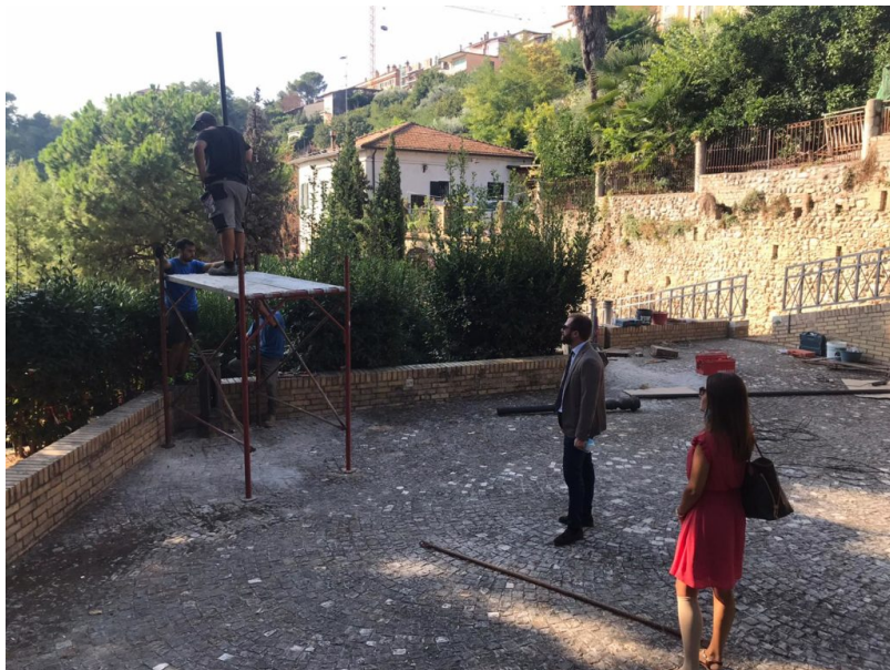
Salita Monte Grappa Giulianova

Ripristinati i pali della luce oggetto di atti vandalici ed installate due nuove telecamere ad alta risoluzione