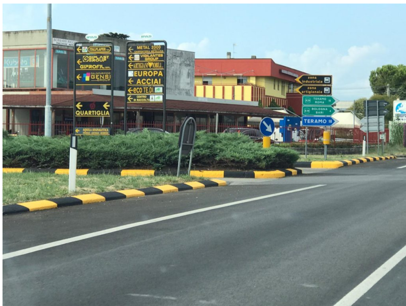
strada di Giulianova

GIULIANOVA - Prosegue a pieno ritmo il piano di manutenzione delle strade e della riqualificazione urbana della città di Giulianova avviato dall'Amministrazione Costantini. Grazie ad interventi in economia, è in corso un programma completo di rifacimento dei cordoli stradali posti in prossimità delle rotatorie e dei principali incroci presenti sul territorio comunale da nord a sud, a partire da quelli già realizzati all'incrocio per Bivio Bellocchio, zona industriale di ColleranESCO, incrocio di viale Gramsci in prossimità dell'Ospedale e tanti altri: