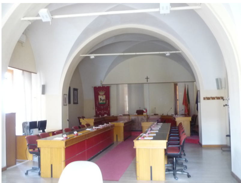
Sala consiliare del Comune di Giulianova