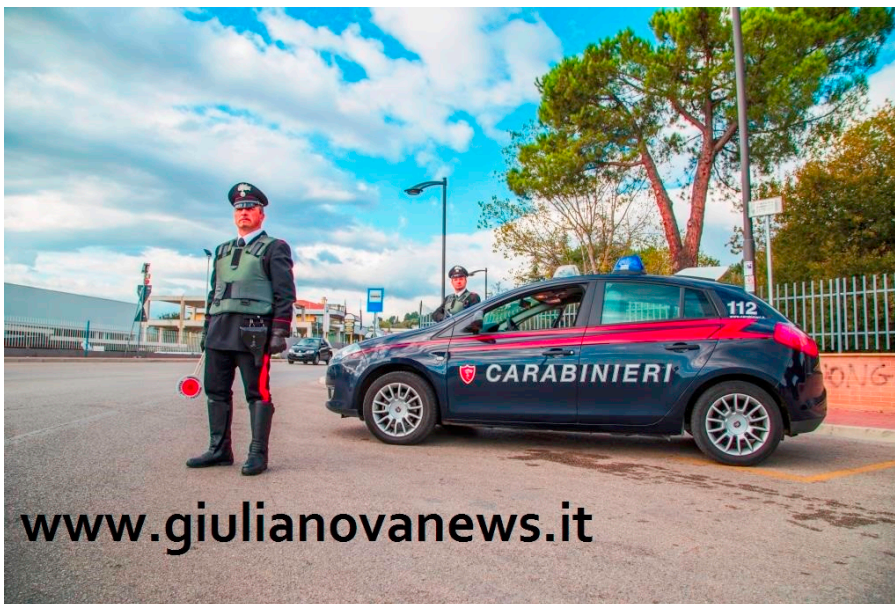
Carabinieri Foto Archivio

Il Comando Provinciale di Teramo, nell'ambito dell'intensificazione estiva dei servizi di vigilanza sul territorio, ha disposto controlli straordinari che hanno riguardato l'intera provincia nella notte tra il 13 e il 14 agosto. I servizi sono stati eseguiti da personale delle tre Compagnie Carabinieri dipendenti (Teramo, Alba Adriatica e Giulianova) e sono stati mirati a prevenire e reprimere tutte le violazioni amministrative e penali correlate alla movida notturna, specialmente nella zona costiera. Particolare attenzione è stata rivolta alla somministrazione di bevande alcoliche ai minori, un fenomeno del quale non è possibile quantificare la diffusione, ma che dal termine del lockdown desta particolare preoccupazione tra le famiglie e a livello sociale, soprattutto lungo la costa adriatica. Altro importante obiettivo fissato per i militari operanti è stato quello di verificare l'applicazione delle norme di contenimento del contagio del COVID-19, che prevedono il distanziamento sociale sia all'esterno che all'interno degli esercizi pubblici. Nel corso dei servizi, che hanno visto impegnati oltre 50 Carabinieri, sono