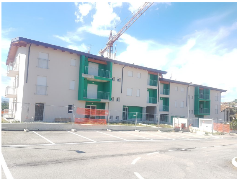
palazzine via Bellini

Publicato sul sito web istituzionale del Comune di Giulianova il bando con il quale si procederà all'assegnazione degli alloggi della palazzina di edilizia sociale realizzata in via Bellini, con affitti a canone sostenibile e rivolto soprattutto alle giovani coppie, agli anziani, alle persone diversamente abili e alle famiglie a basso reddito.