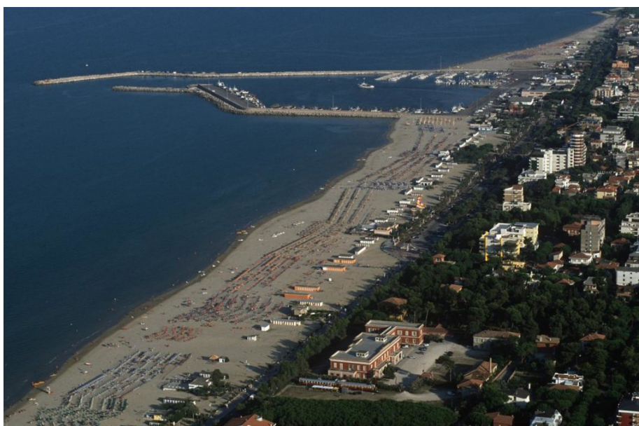
Giulianova.

Domani, venerdì 03 luglio 2020 alle ore 9.30, allo stabilimento balneare “Novavita Beach” sul Lungomare Zara di Giulianova Lido, si terrà la conferenza stampa di presentazione del progetto “CIAO ...sono Giulia di Giulianov@ e ti presento la mia città!” e del vincitore del Concorso di Idee “Giulia di Giulianov@”, che ha realizzato la “family ambassador” del prodotto turistico offerto dalla città.