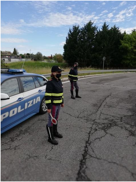
Polizia di Stato - Questura di Teramo Archivio